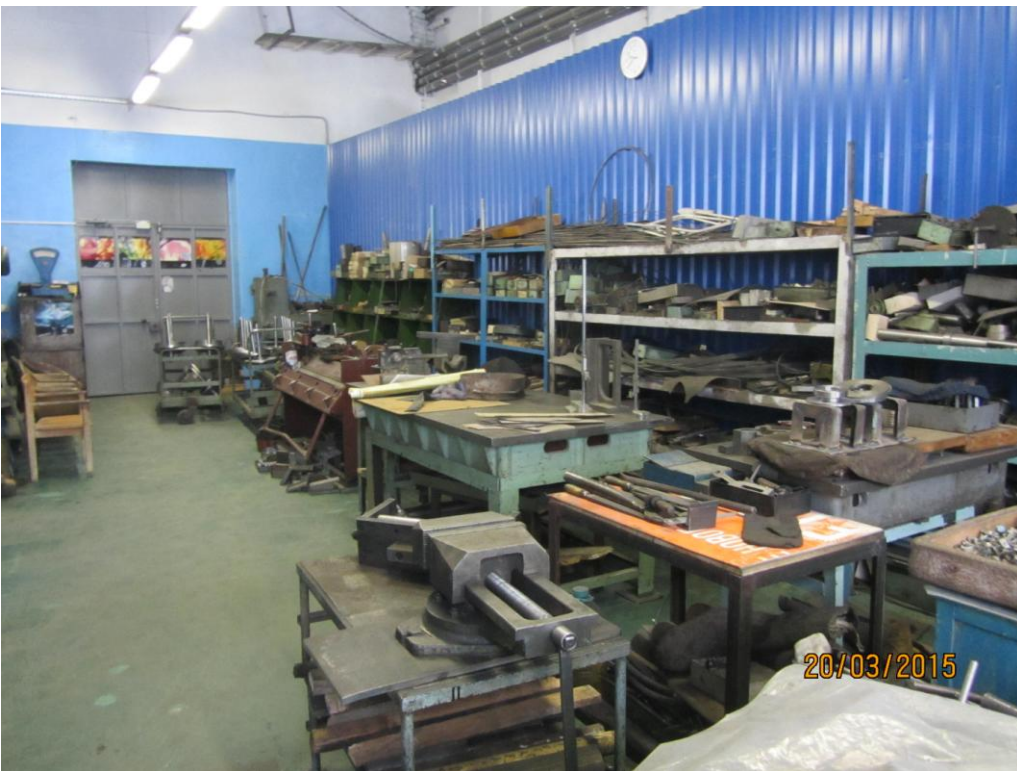
8. Вид механического участка (слесарные места)