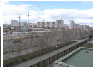
фото 4 вид ул. Малахова (северо-запад)