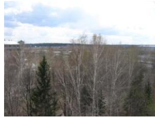
фото 3 вид на юго-запад