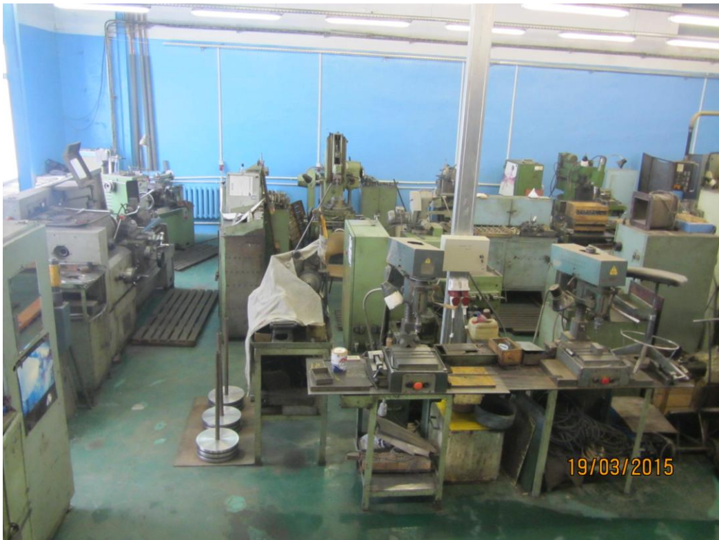
7. Вид механического участка (металлообрабатывающие станки).