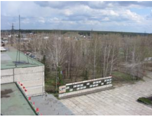
фото 1 вид на юго-восток

Алтайский край, г. Барнаул, Индустриальный район, адрес ул. Малахова 177е