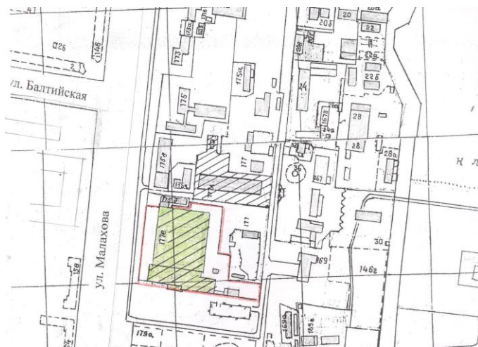
фото 5 расположение предприятия в районе