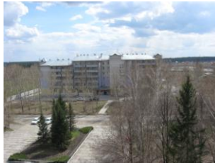
фото 2 рядом стоящее здание на юг